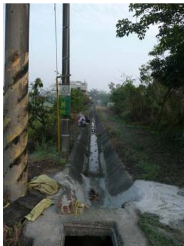
圖說：因開挖排水溝而擾出陶片