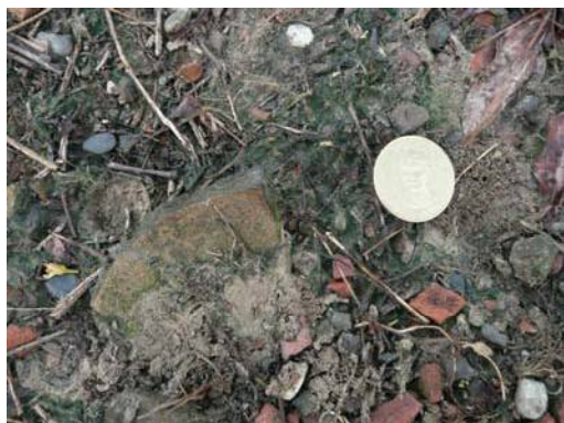
圖說：地表採集之陶罐口緣